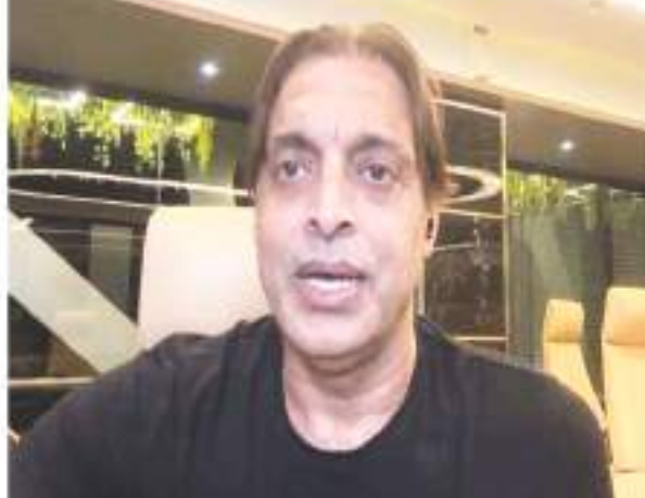
कम गति से गेंदबाजी कर रहे हैं, लेकिन मैं 145 किमी प्रति घंटा तक गायब है।

करांची। पाकिस्तान के पूर्व तेज गेंदबाज शोएब अख्तर ने एशिया कप 2023 के शुरुआती चरण में चिर-प्रतिद्वंद्वी भारत और पाकिस्तान के बीच बहुप्रतीक्षित मुकाबले से पहले तेज गेंदबाज शाहीन शाह अफरीदी की जम्कर तारीफ की।