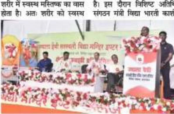
शरीर में स्वस्थ मस्तिष्क का वास होता है। अतः शरीर को स्वस्थ रखने के लिये खेलकूद एवं योगासन की प्रमुख भूमिका होती है।

प्रयागराज। विद्या भारती पूर्वी उत्तर प्रदेश द्वारा आयोजित 34वीं क्षेत्रीय कबड्डी प्रतियोगिता का उद्घाटन ज्वाला देवी सरस्वती विद्या मंदिर इण्टर कॉलेज में हुआ।