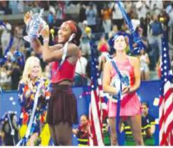
मुकामले की शुरुआत अच्छी नहीं रही। सबलोक ने पहले सेट को 6-2 से अपने नाम किया।

न्यूयॉर्क। अमेरिका की 19 वर्षीय कोको गॉफ यूएस ओपन 2023 की चैंपियन बन गईं हैं।